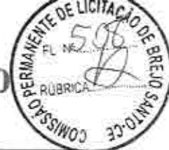
Sergio de Moraes Costa Secretário de Esporte, Lazer e Juventude Prefeitura Municipal de Brejo Santo-Ce